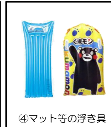
④マット等の浮き具