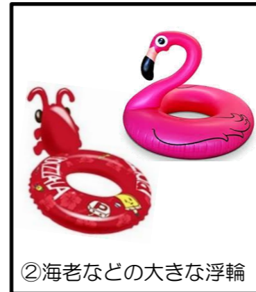
②海老などの大きな浮輪