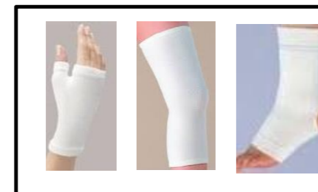
⑱膝・肘・手首・足首等のサポーター