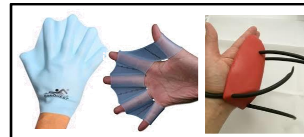
⑰シリコン・フィンガー・ピーナッツのパドル