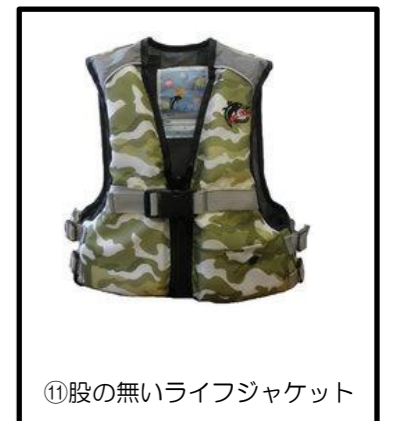
⑪股の無いライフジャケット