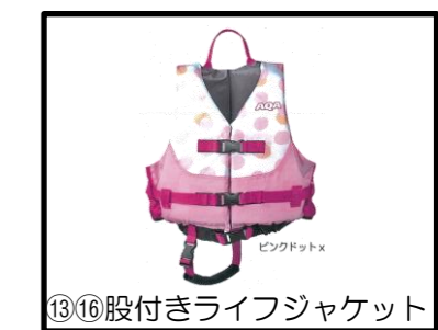
⑬⑯股付きライフジャケット