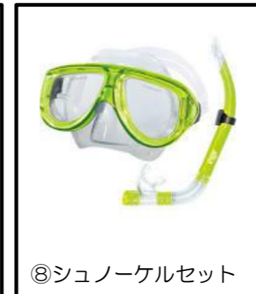
⑧シュノーケルセット