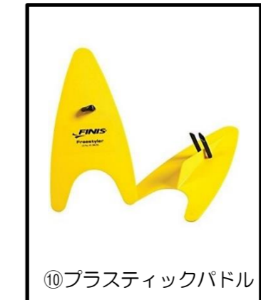
⑩プラスチックパドル