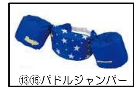
⑬⑮パドルジャンパー