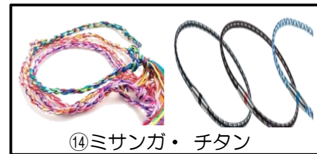
⑭ミサンガ・チタン