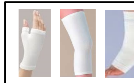
⑱膝・肘・手首・足首等のサポーター