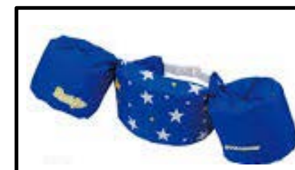
⑬⑮パドルジャンパー