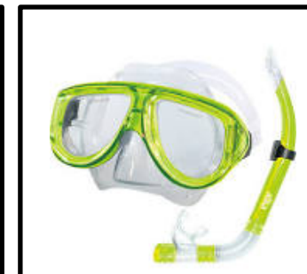
⑧シュノーケルセット