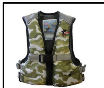
⑪股の無いライフジャケット