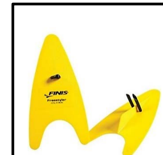
⑩プラスチックパドル