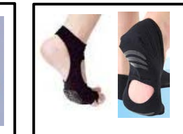
⑲水中ウォーキング用ソックス