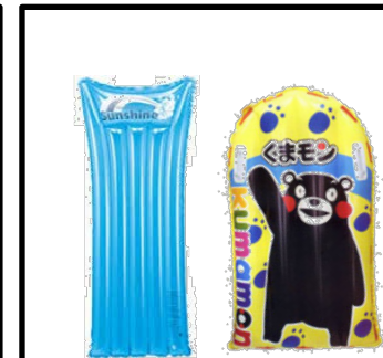
④マット等の浮き具