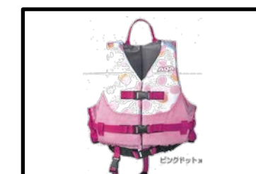
⑬⑯股付きライフジャケット