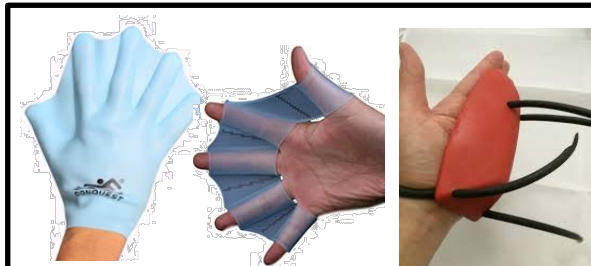
⑰シリコン・フィンガー・ピーナッツのパドル