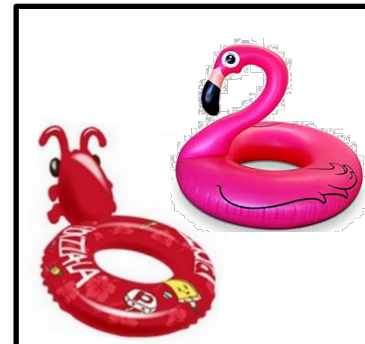
②海老などの大きな浮輪